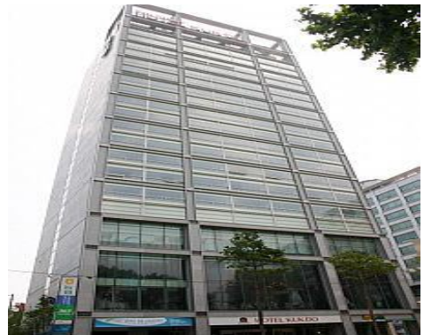
BWP国都<東大門とロッテホテルの中間の位置>